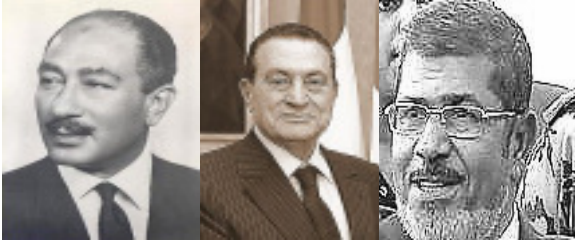
ಅನ್ವರ್ ಸಾದತ್ ಹೊಸ್ನಿ ಮುಬಾರಕ್ ಮೊಹಮ್ಮದ್ ಮೋರ್ಸಿ

ಮಾತ್ರ ಕೊನೆಯವರೆಗೂ ನಿಷ್ಠೆಯಿಂದ ನಡೆದುಕೊಂಡ. ಇವನ ವಿಧೇಯ ನಡವಳಿಗೆಗೆ ಬಹುಮಾನವಾಗಿ ಅಮೇರಿಕ ಇವನಿಗೆ ಯಥೇಚ್ಛ ಡಾಲರುಗಳನ್ನು ಶಸ್ತ್ರಾಸ್ತ್ರಗಳನ್ನು ಪೂರೈಸಿತು. ನಾಸೆರ್‌ನ ಆದರ್ಶಗಳನ್ನು ಈಜಿಪ್ಟ್ ಸಂಪೂರ್ಣವಾಗಿ ಕೈಬಿಟ್ಟಿತ್ತು. ಹೊಸ್ನಿ ಮುಬಾರಕ್‌ನ ಕೂರ ಹಾಗೂ ನಿರಂಕುಶ ಆಳ್ವಿಕೆಯ ವಿರುದ್ಧ ೨೦೧೧ರಲ್ಲಿ ದೇಶದಲ್ಲಿ ನಡೆದ ಜನಾಂದೋಲನದಲ್ಲಿ ಆತ ಪದಚ್ಯುತಿಗೊಂಡು ಸೆರೆಮನೆ ಸೇರಿದ. ಆದರೆ ಅಧಿಕಾರ ಆಗಲೂ ಸೇನೆಯದ್ದೇ ಆಗಿತ್ತು. ಮುಸ್ಲಿಮ್ ಬ್ರದರ್‌ಹುಡ್ ದೇಶದ ರಾಜಕೀಯದಲ್ಲಿ ನಿರ್ಣಾಯಕ ಶಕ್ತಿಯಾಗಿ ಬೆಳೆದು ಅದರ ನಾಯಕ ಮೊಹಮ್ಮದ್ ಮೋರ್ಸಿ ಈಗ ಅದರ ಅಧ್ಯಕ್ಷನಾಗಿದ್ದಾನೆ. ಈತನೂ ಈಗ ಜನತೆಯ ವಿರೋಧ ಎದುರಿಸುತ್ತಿದ್ದಾನೆ. ಮುಬಾರಕ್‌ನ ವಿರುದ್ಧ ನಡೆದ ಆಂದೋಲನಕ್ಕೆ ಈತನ ಮೂಲಭೂತವಾದಿ ಸಂಘಟನೆಯ ಕೊಡುಗೆಯೂ ದೊಡ್ಡದಾಗಿತ್ತು.