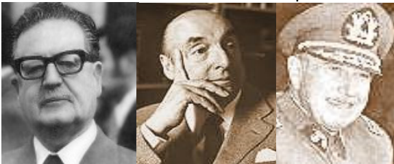
ಅಧ್ಯಕ್ಷ ಅಲೆಂಡೆ ಕವಿ ನೆರೂಡಾ ಜ|| ಪಿನೋಶೀಟ್

ಸೇನಾ ದಂಗೆಯಲ್ಲಿ ೬೦ ಸಾವಿರ ಜನ ಕೊಲೆಯಾದರು. ೨೦೦೧ ಸೆಪ್ಟೆಂಬರ್ ೧೧ರ ವೈಮಾನಿಕ ದಾಳಿಯಲ್ಲಿ ಸಾವಿಗೀಡಾದ ಅಮೇರಿಕನ್ ಪ್ರಜೆಗಳ ಜೀವ ಮಾತ್ರ ಅಮೂಲ್ಯವಾದದ್ದು; ಆದರೆ ತೃತೀಯ ಜಗತ್ತಿನ ದೇಶಗಳಲ್ಲಿ ತಾನು ನಡೆಸಿದ ರಾಜಕೀಯ ಹಸ್ತಕ್ಷೇಪಗಳಲ್ಲಿ ಬಲಿಯಾದವರು ಮನುಷ್ಯ ಜೀವಗಳೇ ಅಲ್ಲ ಎಂಬಂತೆ ಅಮೇರಿಕ ವರ್ತಿಸುತ್ತದೆ; ಪ್ರಜಾಪ್ರಭುತ್ವ ಮಾನವಹಕ್ಕು, ಸ್ವಾತಂತ್ರ್ಯ ಮುಂತಾದ ವಿಚಾರಗಳ ಬಗ್ಗೆ ಅದರ ವಿವರಣೆಗಳಿಗೂ ವಾಸ್ತವದ ಜಗತ್ತಿನಲ್ಲಿ ಅದು ನಡೆದುಕೊಳ್ಳುತ್ತಿರುವ ರೀತಿಗೂ ಅರ್ಥಾರ್ಥ ಸಂಬಂಧವೇ ಇಲ್ಲ.