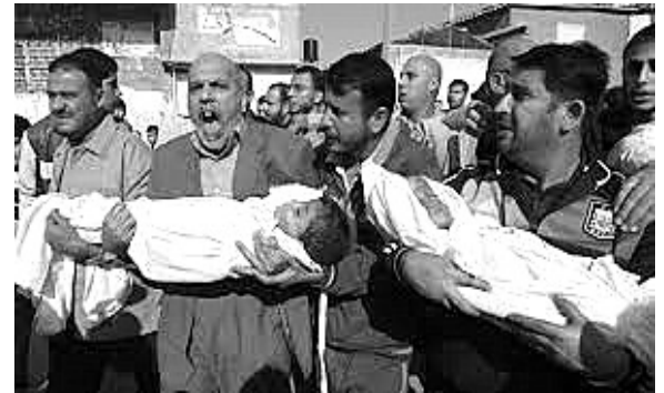
ಗಾಝಾದಲ್ಲಿ ಇಸ್ರೇಲಿ ಬಾಂಬ್ ದಾಳಿಯ ದಾರುಣ ಚಿತ್ರ

ಪ್ರಜಾಪ್ರಭುತ್ವ ಮಾನವ 'ಹಕ್ಕು, ಹಿಂಸೆ, ಭಯೋತ್ಪಾದನೆ ಇತ್ಯಾದಿ ವಿಚಾರ ಹಾಗೂ ವಿದ್ಯಮಾನಗಳ ಬಗ್ಗೆ ಇವತ್ತು ಅಮೇರಿಕದ ನಿರೂಪಣೆಗಳು ಇಡೀ ಜಗತ್ತನ್ನೇ ಆಳುತ್ತಿವೆ. ನಮ್ಮ ದೇಶದ ಮಾಧ್ಯಮಗಳಿಗೂ ಈಗ ಅಮೇರಿಕವೇ ಹಿರಿಯಣ್ಣ. ಪ್ರಜಾಪ್ರಭುತ್ವ ಮಾನವ ಹಕ್ಕು ಇತ್ಯಾದಿಗಳ ಬಗ್ಗೆ ಅಮೇರಿಕದ ಸ್ವಘೋಷಿತ ಬದ್ಧತೆಯನ್ನು ಒಪ್ಪಿಕೊಳ್ಳುವ ಮೊದಲು ೧೯ನೆಯ ಶತಮಾನದ ಯುರೋಪ್‌ನ ವಸಾಹತುಶಾಹಿ ಮತ್ತು ೨೦ನೆಯ ಶತಮಾನದಲ್ಲಿ ಅದರದ್ದೇ ಮುಂದುವರಿಕೆಯಾಗಿರುವ ಅಮೇರಿಕದ ಸಾಮ್ರಾಜ್ಯಶಾಹಿ, ಏಷ್ಯ, ಆಫ್ರಿಕ